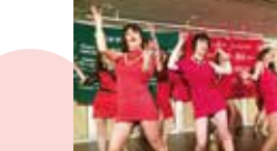
魅惑のベリーダンス!