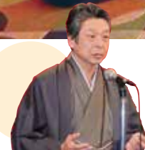
宮井副代表理事の乾杯挨拶