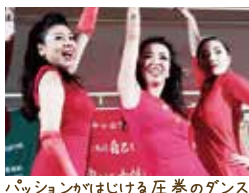
パッションがはじける圧巻のダンス!